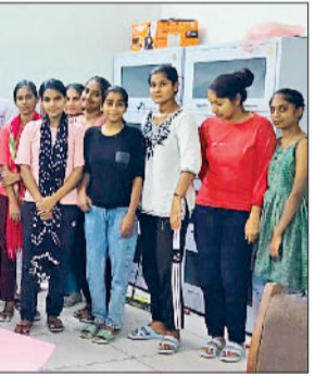
भिवानी। सामुदायिक पुस्तकालय को इनवर्टर भेंट करते प्रोत्साहन सोशल वेलफेयर सोसाइटी व डॉक्टर भीमराव चेट्टेबल ट्रस्ट के सदस्य।

गांव खेड़ीबत्तर के केशर जोन में नवजात बच्ची का शव मिला। सूचना के बाद पुलिस व एफएसएल टीम ने घटनास्थल से साक्ष्य जुटाए और जोन में लगे सीसीटीवी फुटेज खंगाली जा रही है। पुलिस ने अज्ञात के खिलाफ मामला दर्ज कर बच्ची को पोस्टमार्टम के लिए सामान्य अस्पताल भिजवा दिया। दादरी जिले के गांव खेड़ीबत्तर में श्रमिकों के बच्चे खेल रहे थे। बच्चों