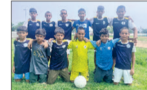
चरखी दादरी। प्रतियोगिता में दादरी जिले की टीम।