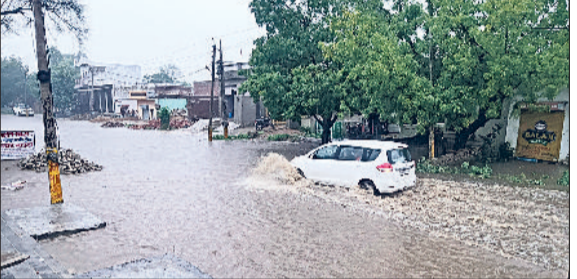
दिगावा मंडी। बारिश के पानी को चिर कर गंतव्य की ओर जाती एक कार व बारिश के पानी में पड़ती बूंदों के बाद उठते बुलबुले।

पिछले कई दिनों से पड़ रही भीषण गर्मी के बीच रविवार दोपहर बाद जबरदस्त गर्मी के बाद बादलों ने जमकर पानी बरसाया। करीब 20 मिनट की बारिश ने गर्मी व उमस को छू मंतर कर दिया। लोगों को गर्मी से राहत मिली। वहीं तेज बारिश के चलते ढलान वाले इलाकों में जलभराव की स्थिति बनी, लेकिन पब्लिक हेल्थ विभाग द्वारा बारिश के दौरान पम्पसेट चलाए जाने के बाद शहर के लोगों को जल्द ही पानी की समस्या से छुटकारा मिल गया। भिवानी के अलावा बवानीखेड़ा, लोहारू के अलावा अन्य आसपास के इलाकों में जोरदार बारिश ने लोगों को गर्मी से राहत दिला दी। वहीं अच्छी बारिश से खरीफ की फसलों में