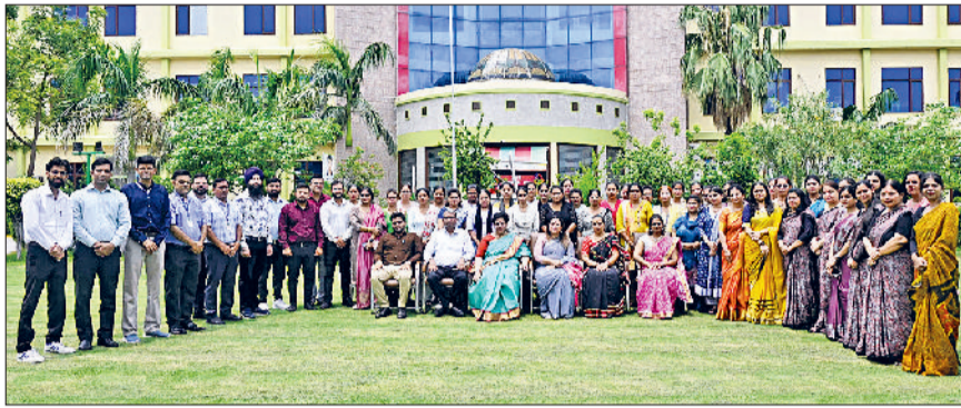
भिवानी। आयोजित प्रशिक्षण शिविर में उपस्थित शिक्षक व अन्य पदाधिकारी।