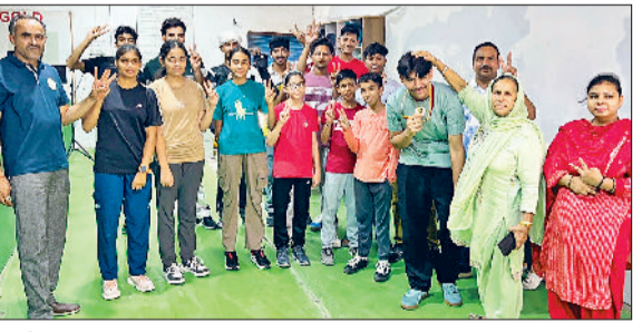
भिवानी। पदक विजेता को सम्मानित करते हुए।

तथा दुर्घटना वाहन चालकों व पहल राहगीरों को काफी परेशानी का सामना करना पड़ा। इस बरसात ने लोगों को उमस भरी गर्मी से राहत बरसात प्रदान की है वहीं यह बरसात बाजार व कपास आदि फसल के लिए भी काफी उपयोगी बताई जा रही है। उधर बरसाती सीजन को ध्यान में रखते हुए नगर पालिका