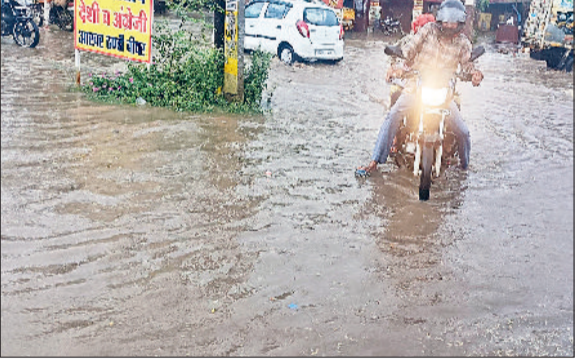
लोहारू। बारिश के जमा पानी से गुजरता एक बाइक चालक व कचरे की सड़कों पर जमा बारिश के पानी का दृश्य।

लोहारू और आसपास के इलाके में रविवार सायं मानसून की दस्तक हुई और दोपहर बाद सायं करीब तीन बजे बाद आधे घंटे तक झमाझम बरसात हुई। इस बरसात ने जहां लोगों को पिछले एक सप्ताह से पड़ रही उमस भरी गर्मी से राहत प्रदान की वहीं शहर के अनेक चौराहे और निचले इलाके जलमग्न हो गए। आधे घंटे के दौरान इलाके में करीब दस एमएम से अधिक बरसात मानी जा रही है। बता दें कि पिछले करीब एक सप्ताह से इलाके लोग उमस भरी गर्मी से परेशान थे और दिन के समय कूलरों ने भी जवाब दे रखा था। पिछले दो दिनों से इलाके में घने काले बादल छाने के बाद इलाके के लोगों को मानसून