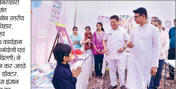
भिवानी। बाल संत समागम के दौरान एक बाल संत से बातचीत करते हुए।