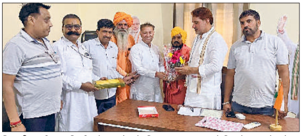
भिवानी। धर्मशाला निर्माण में सहयोग के लिए सुभाष बराला से मिलते बहल के लोग।

हरिभूमि न्यूज़ ▶▶ बहल कस्बे में बनने वाली श्रीअलख धर्मशाला के लिए राज्यसभा सांसद सुभाष बराला ने मदद का हाथ बढ़ाया है। उन्होंने धर्मशाला निर्माण के लिए अपने राज्यसभा सांसद कोट से श्रीअलख जनसेवा ट्रस्ट को 11 लाख रुपये देने की घोषणा की है। उन्होंने अपने प्रयास से 23 गुणा 28 वर्ग फुट का हॉल बनाने में मदद का आश्वासन दिया है। श्रीअलख जनसेवा ट्रस्ट ने धर्मशाला निर्माण में सहयोग के लिए राज्यसभा सांसद बराला का आभार जताया है। इससे पहले पूर्व मंत्री जेपी दलाल ने धर्मशाला निर्माण के लिए 21 लाख रुपये का सहयोग दिया था। पिछले काफी समय से कस्बे में ऐसी धर्मशाला की जरूरत महसूस की जा रही थी, जिसमें बाहर से आने वाले लोगों को आश्रय मिल सके। इस