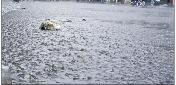
भिवानी। बारिश का छत से पतनाल से बहता पानी का दृश्य।