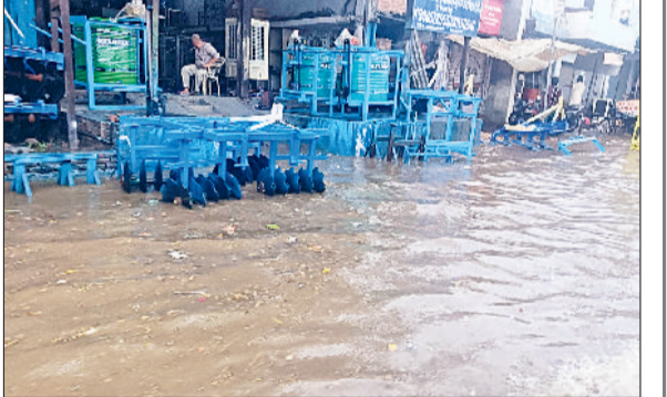
लोहारू। बारिश के जमा पानी से गुजरता एक बाइक चालक व कचरे की सड़कों पर जमा बारिश के पानी का दृश्य।

की बरसात शुरू होने की उम्मीद बजने लगी थी। रविवार दोपहर तीन बजे के बाद लोहारू और आसपास के इलाके में आसमान को घनघोर घटाओं ने घेर लिया और झमाझम बरसात का दौर शुरू हो गया। करीब आधे घंटे तक हुई यह बरसात आंकड़ों के हिसाब से दस एमएम से अधिक मानी जा रही है। बरसात के