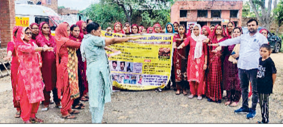
भिवानी। गांव मानहेरूम में जागरूकता अभियान चलाने की शपथ दिलाते हुए।